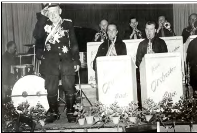
... mit dem Kurorchester