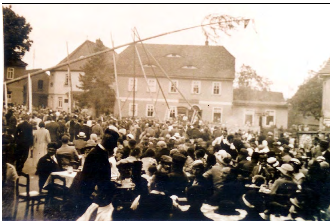
Maibaumsetzen zu Anfang der 1920er Jahre in Bad Klosterlausnitz.

Für uns heute unvorstellbar. Jede Versicherung würde unter solchen Bedingungen ihren Schutz versagen und etwaige Haftpflichtansprüche würden jeden Verantwortlichen in den Ruin treiben. Heute ist beim Setzen die größtmögliche Vorsicht geboten, dass keiner der Aktiven oder der Gäste zu Schaden kommt. Das Um- und Vorsicht nötig sind, dass soll die folgende Aufzählung von Unfällen und Havarien, welche, wenn auch sehr selten, so doch in machen Jahren das schöne Pfingstfest überschatteten.