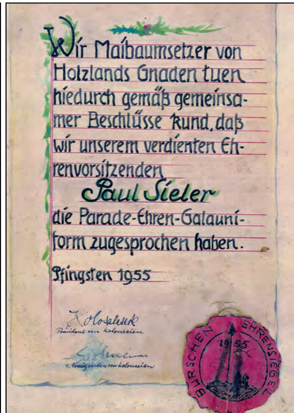
Im Jahr 1955 erhält er die „Parade-Ehren-Galauniform“ zugesprochen.