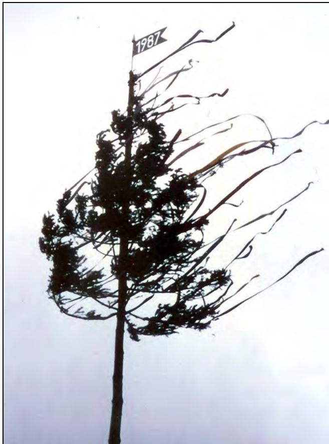
Klosterlausnitzer Maibaumgipfel 1987

Wer zu Pfingsten unser Holzland durchwandert, der findet fast in jedem Ort auf einen freien Platz einen hohen Fichtenstamm, dessen Gipfel mit bunten Bändern geschmückt ist. Das ist der „Mee“, wie der Maibaum im Holzland genannt wird, das Wahrzeichen aller Holzlanddörfer.