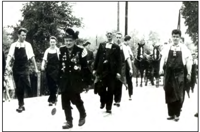
... beim Burschenumzug um 1955