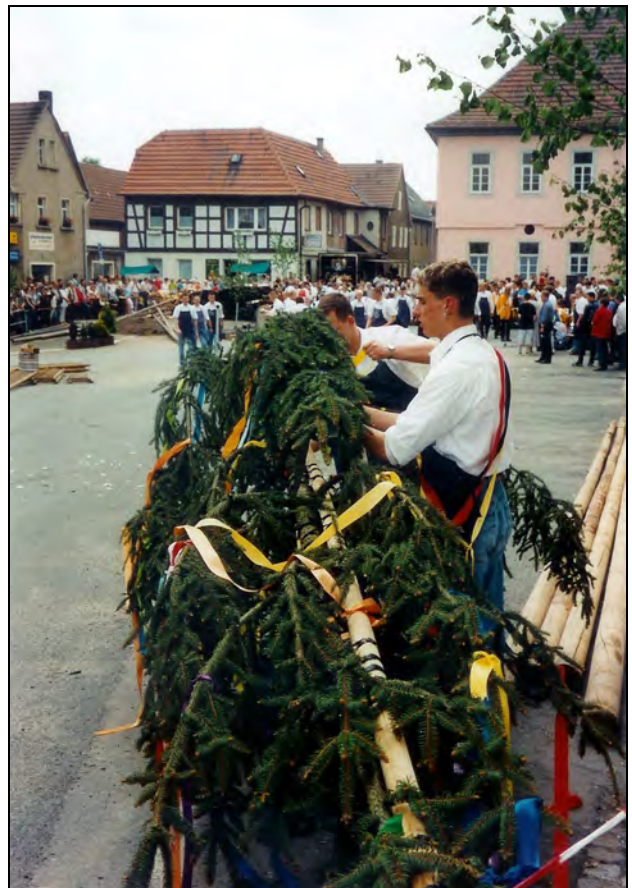
Schmücken des Gipfels 1999

Der Maibaum symbolisiert das erwachende Leben nach langem Winterschlaf, die Vorfreude auf den kommenden Sommer.